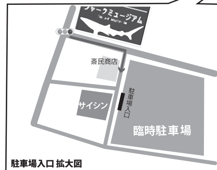
駐車場入口拡大図